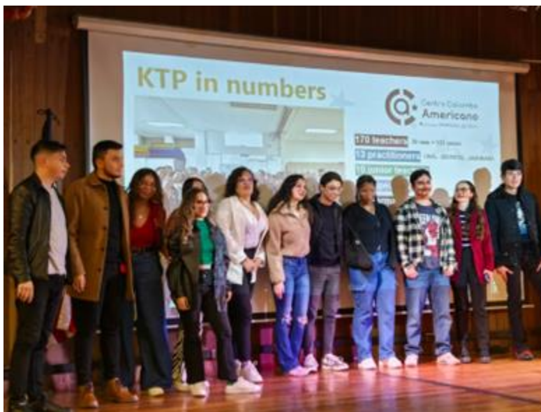
Ilustración 17. Participación practicantes Facultad de Ciencias y Educación

Los estudiantes no solo pudieron aplicar y fortalecer sus conocimientos en un contexto real de enseñanza, sino que también adquirieron experiencia práctica en el diseño de clases, la interacción con estudiantes de diversos niveles y el uso de metodologías innovadoras en la enseñanza de idiomas.