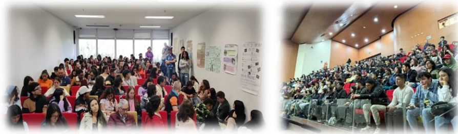
Ilustración 13. Semana Universitaria

Dentro de las novedades se diseñó e implementó un pasaporte, el cual fue entregado a los participantes, en este se registraba a través de sellos, la participación en las diversas actividades, se estima una participación, en la mayoría de los casos con aforo completo en los espacios dispuestos.