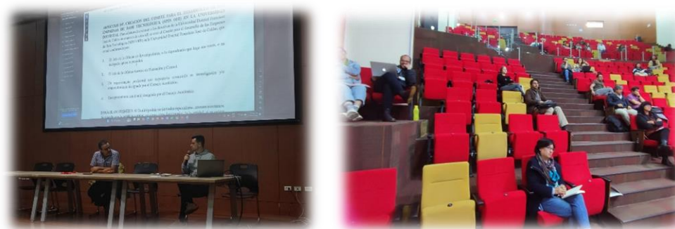
Ilustración 14 Spin Off