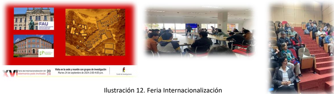
Ilustración 12. Feria Internacionalización