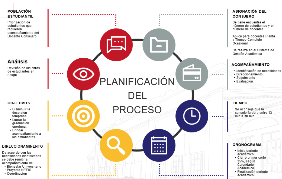
Ilustración 9. Proceso Consejerías Facultad de Ciencias y Educación

Asimismo, se diseñaron dos formatos en Excel con el fin de realizar un diagnóstico cualitativo y cuantitativo de la población estudiantil que permita direccionar las estrategias de acompañamiento según el caso. Para la Facultad de Ciencias y Educación es fundamental tener una comunicación asertiva con Bienestar Universitario con el objetivo de brindar las mejores condiciones a nuestros estudiantes y lograr el objetivo de disminuir la deserción temprana.