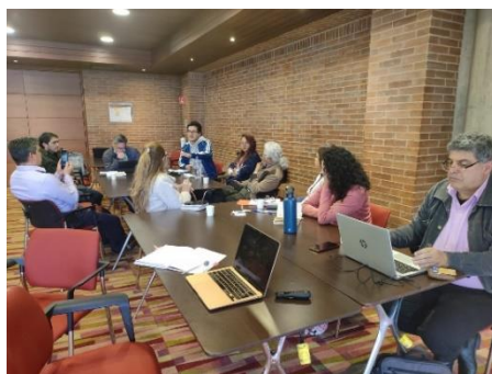
Ilustración 1. Taller Internacionalización

El taller estuvo conformado por 4 mesas de trabajo, quienes desde un ejercicio práctico debatieron las necesidades reales que tiene la Facultad, además, de diseñar estrategias que permitan establecer la hoja de ruta por la cual se debe seguir para lograr la internacionalización. Es de resaltar que, para este tipo de políticas se debe establecer un plan de trabajo donde se identifique los recursos tecnológicos, humanos, académicos y físicos que permitan una adecuada implementación. En un primer momento, se invitó a cada asistente a identificar una buena práctica institucional, sus principales características, tres (3) dificultades y proponer una estrategia de mejora para esas dificultades.