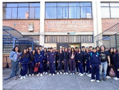
Ilustración 7. Visita de Colegios a la Facultad