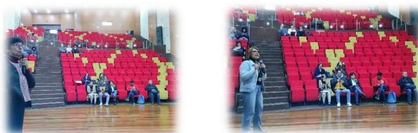
Ilustración 11. I Encuentro de Consejerías

Como estrategia para disminuir la deserción se presentaron experiencias exitosas, esta actividad contó con la participación de coordinadores, docentes de pregrado y posgrados, directora Centro CADEP-ACACIA. A partir de las acciones propuestas por los programas y la reflexión sobre las limitaciones que tenemos por el bajo número de consejeros, se planteó la hoja de ruta para el desarrollo de consejerías en los proyectos curriculares, la cual se dio a conocer a las coordinaciones de pregrado en el segundo semestre del año.