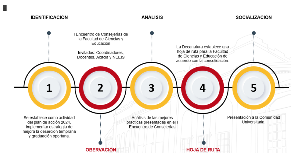
Ilustración 8. Hoja de ruta Consejerías Facultad de Ciencias y Educación

La facultad de Ciencias y Educación con el compromiso adquirido en durante esta vigencia realizó un “I encuentro de consejerías de la facultad”, contó con la participación de coordinadores, docentes y la directora del CADEP-Acacia, el objetivo de este encuentro fue conocer el desarrollo de las consejerías en los programas de pregrado y posgrado; luego, realizar un análisis y presentar una propuesta unificada del proceso para que los programas trabajarán en una misma dirección.