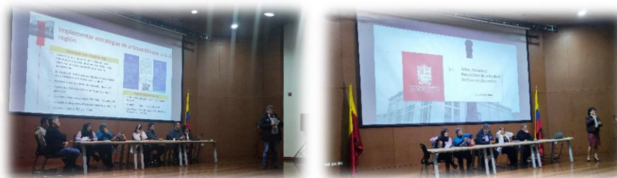
Ilustración 10. Retos, Acciones y Perspectivas de la Facultad

Presentación de los retos identificados en el Consejo ampliado que se había desarrollado meses anteriores y dio a conocer los resultados de algunas acciones que se han realizado por los grupos de trabajo con el fin de fortalecer la Facultad.