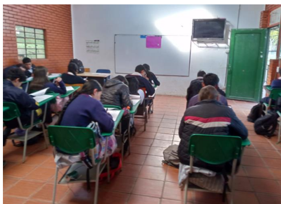
Ilustración 5. Colegio El Salitre