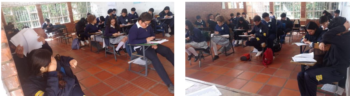
Ilustración 4. Colegio Integrado de la Calera