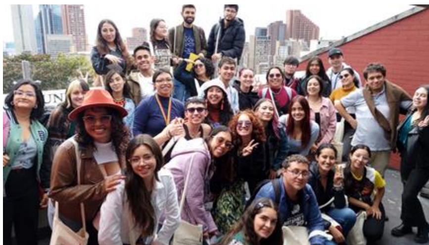
Ilustración 18. Feria de Vivencias de la Práctica Pedagógica en la Ciudad-Región

En el pasado mes de agosto se llevó a cabo la Feria de Vivencias de la Práctica Pedagógica en la Ciudad-Región , en este espacio os estudiantes presentaron sus experiencias y aprendizajes obtenidos durante sus prácticas pedagógicas en diversos contextos urbanos y rurales.