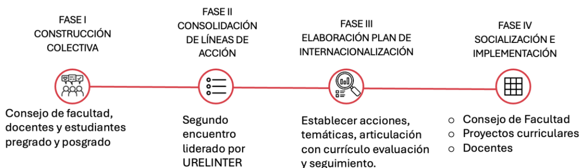
Ilustración 3. Hoja de ruta Plan de Internacionalización

Para la implementación y consolidación del plan de internacionalización, se ha propuesto una hoja de ruta constituida por cuatro fases, tal como se muestra en la siguiente imagen: