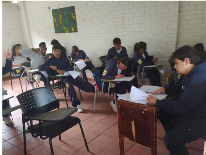
Ilustración 6. Colegio La Aurora