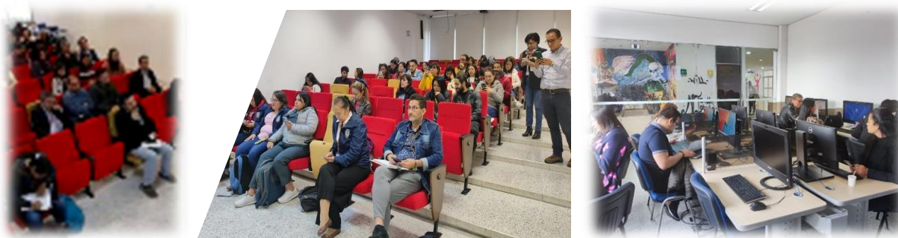
Ilustración 15. Capacitaciones