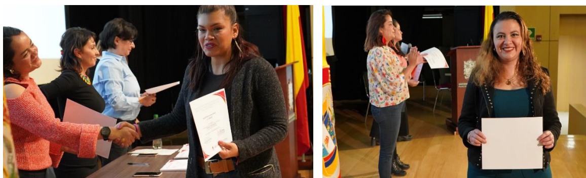
Ilustración 16. Graduación Localidad de Kennedy

Como se evidencia en la Tabla 22 Cursos Especializados, se logró certificar 475 personas, el curso que obtuvo más participación fue el de saberes , seguido del curso Cuidado Adultos mayores .